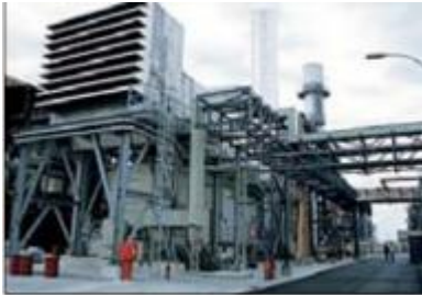
Planta cogeneradora de Torres Motril, IBERDROLA